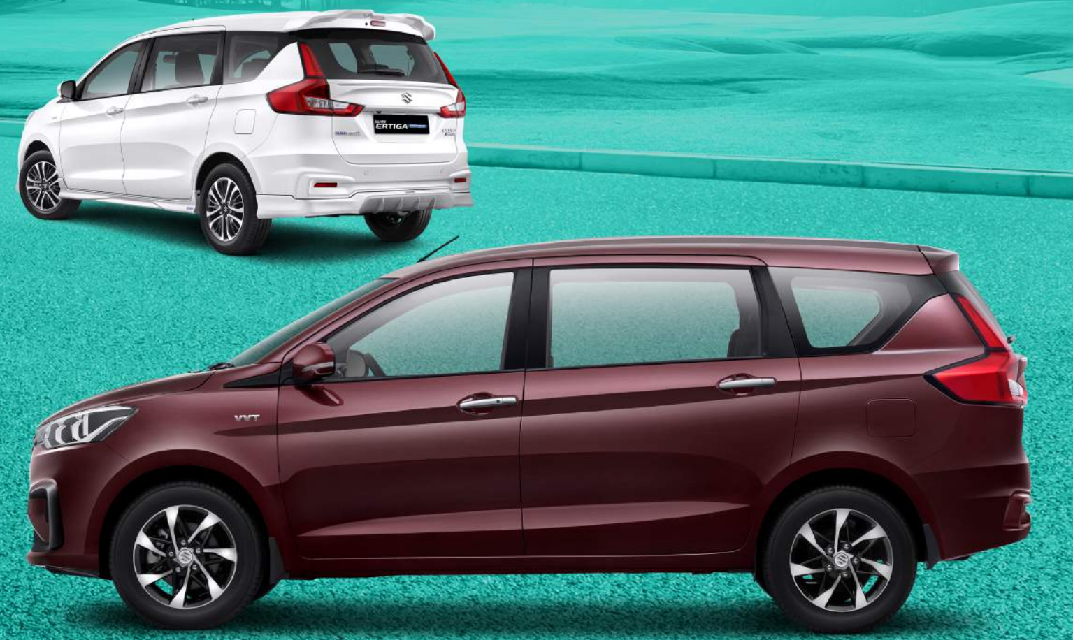
LED REAR COMBINATION LAMPS WITH LIGHT GUIDE (SS, GX)