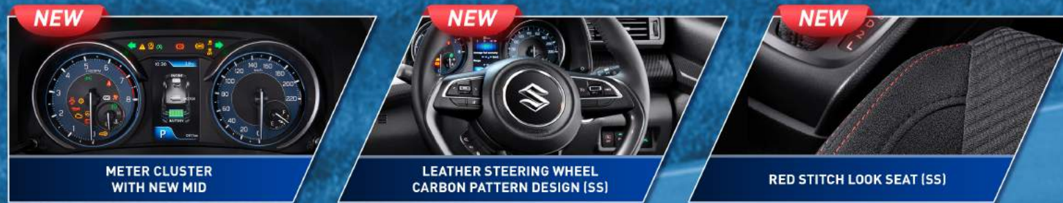
METER CLUSTER WITH NEW MID