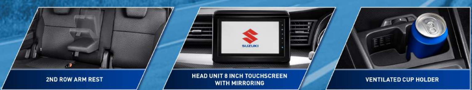
2ND ROW ARM REST