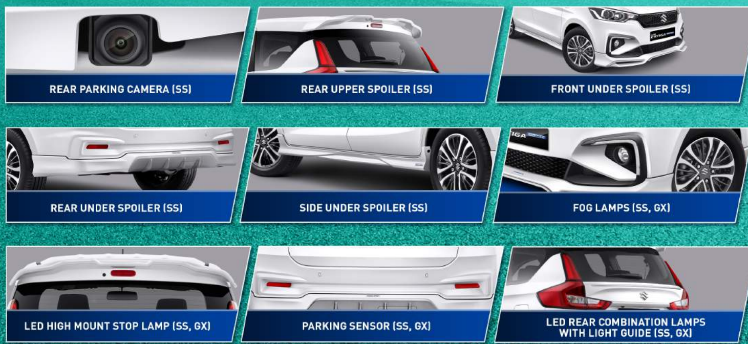
REAR PARKING CAMERA (SS)

All New Ertiga Hybrid hadir dengan tampilan baru yang modern sesuai perkembangan zaman. Sebuah mobil keluarga pintar dengan tampilan premium dan stylish, siap menjadi mobil Kebanggaan Keluarga.