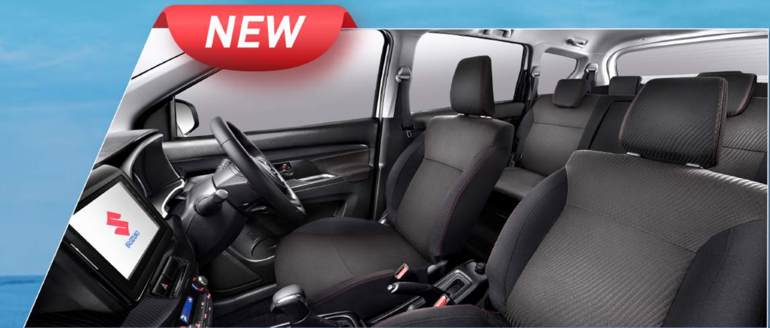
RED STITCH LOOK SEAT (SS)